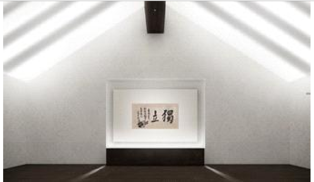
안중근 유묵 상설전시