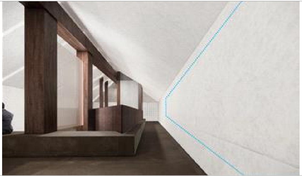
안중근 평화센터 2층 기획전시존 월(15m×2.3m) 공간 시안