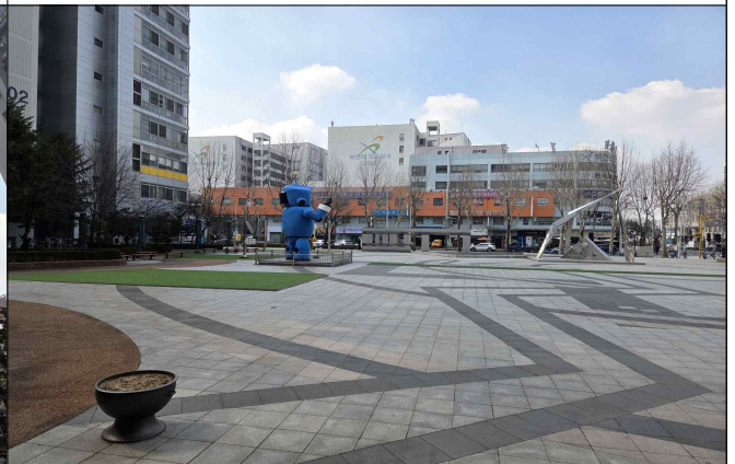
부천테크노파크 401동 전경