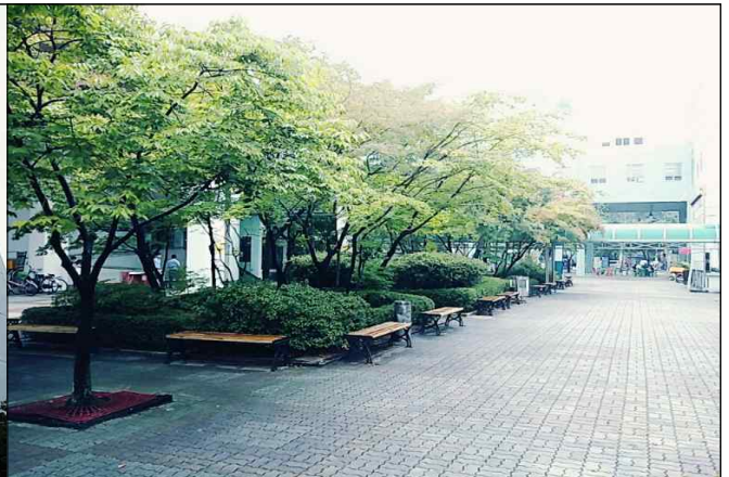
부천테크노파크 2단지 전경