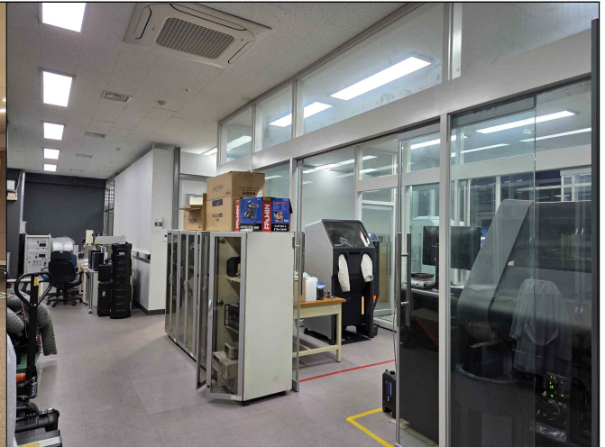
로봇공동연구센터 장비 이용(401동)