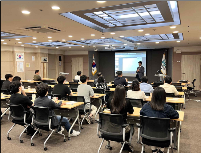
부천산업진흥원 회의실 대관(401동)