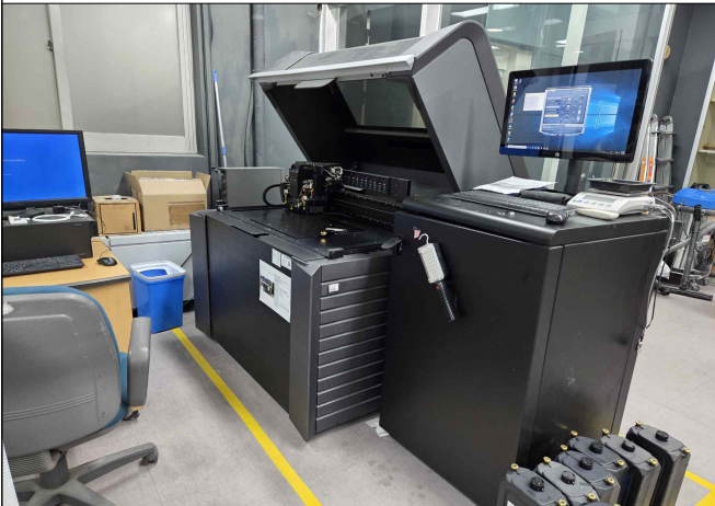
로봇공동연구센터 장비 이용(401동)