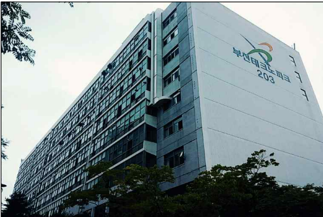
부천테크노파크 2단지 전경