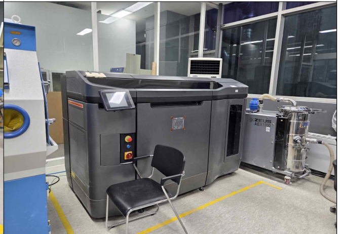
로봇공동연구센터 장비 이용(401동)